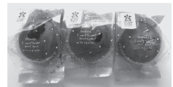
お花のマドレーヌ